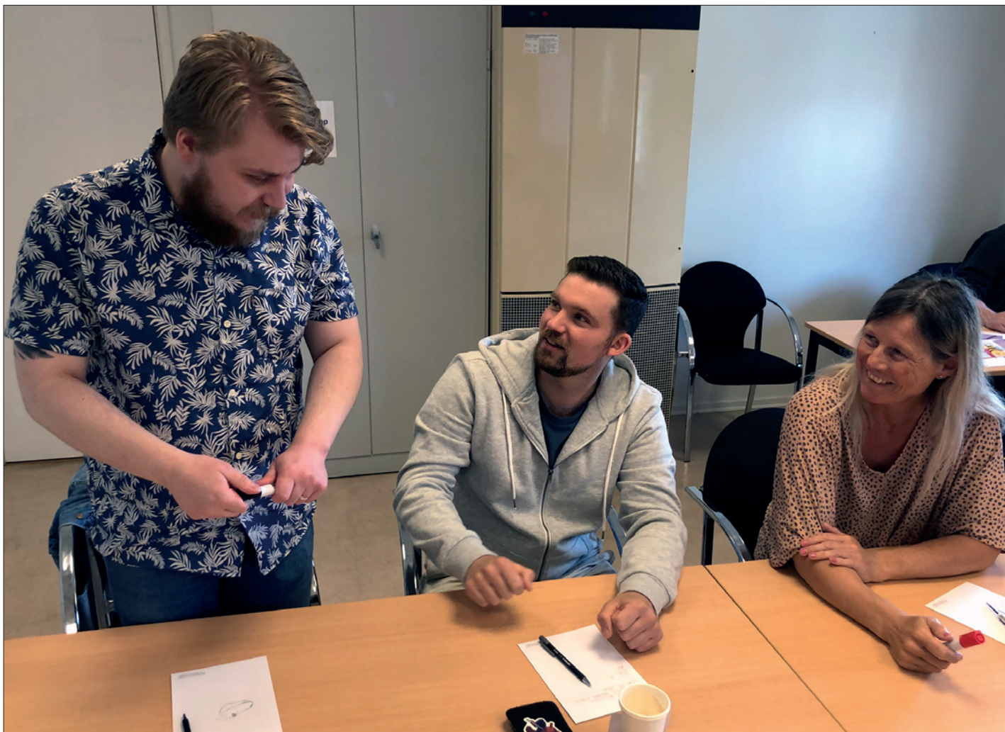
Deltagare på MTM-utbildning på Stenebygården.