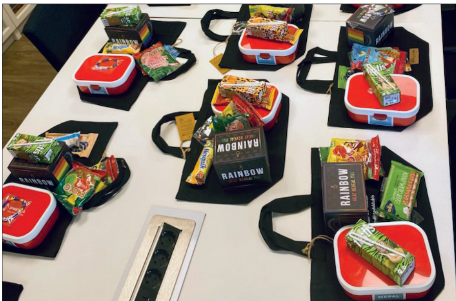
Priser till våra Quiz-vinnare.